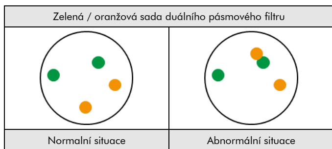
Obr. Č. 2 : Předpokládaný normální výsledek a abnormální jádra

Př ekrývající se signály se mohou objevit jako žluté signály.