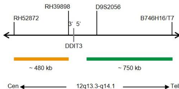
Obr.1: SPEC DDIT3 Mapa sondy (mimo měřítka)

* V souladu s knihovnou lidského genomu GRCh37/hg19