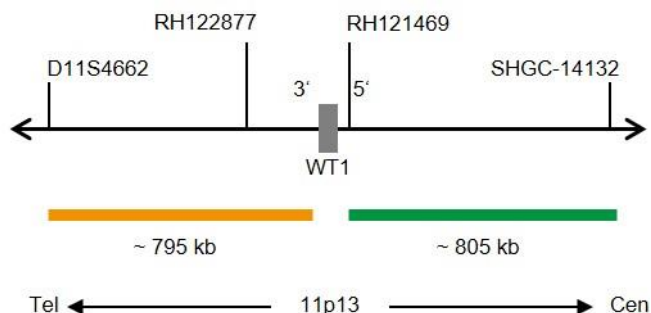
Abb. 1: SPEC WT1 Sondenlokalisation (nicht maßstabsgetreu)

Die ZytoLight SPEC WT1 Dual Color Break Apart Probe ist verfügbar in einer Größe: