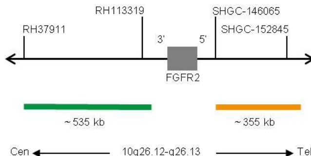
Abb. 1: SPEC FGFR2 Sondenlokalisierung (nicht maßstabsgetreu)

Die ZytoLight SPEC FGFR2 Dual Color Break Apart Probe ist verfügbar in zwei Größen: