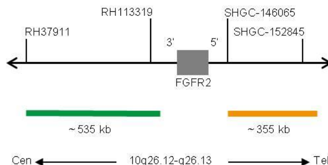
Fig. 1: SPEC FGFR2 Mappa della sonda (non in scala)

*conformemente al Human Genome Assembly GRCh37/hg19