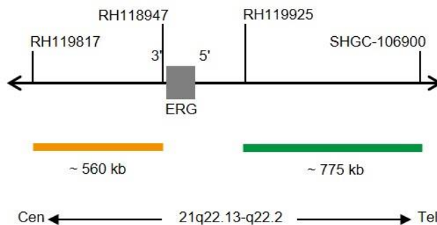
Fig. 1: SPEC ERG Mapa da sonda (sem escala)

*De acordo com o Conjunto do Genoma Humano GRCh37/hg19